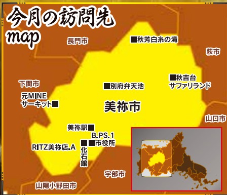
※mapは、スペースの都合上おおまかな位置を掲載しています。