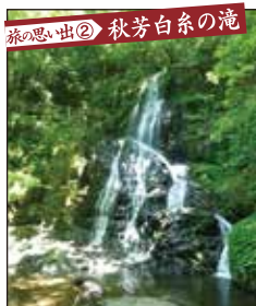
旅の思い出② 秋芳白糸の滝 厚東川の上流に位置し、岩肌を水が白糸のように流れる様から名付けられています。