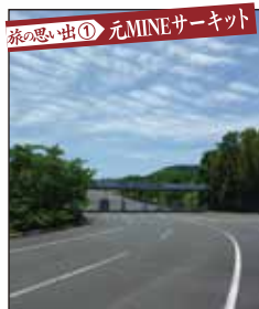
旅の思い出① 元MINEサーキット かつては国内有数の自動車レース場で、現在は美祢自動車試験場となっています。

すると、マイナスイオン効果で？若もツボも当たりが早い！結果、下記のように二人揃って危ない完勝となつたのです。