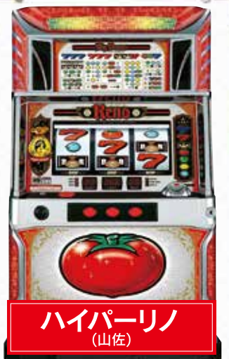
ハイパーリノ (山佐)

そんなアツい勝負を可能にしてくれたのが、山佐から6月に登場した「ハイパーリノ」。連チャンがウリの前作、前々作とは違い、完全Aタイプ。設定1段階で、高確率のボーナスのBIG、REG比率は1対1。トマトからのボーナス期待度も50%と個人のヒキの強さを測るにはもってこい。果たしてパチスタ編集部「ヒキKING」は誰だ!?