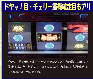
ドヤッ！目の停止はボーナスチャンス。スイカの取りこぼしで停止することもあるので、コインロスという意味でも通常時はしっかりとスイカを狙おう。

大級の暴言だから、全国の沖スロファンとメーカーさんに謝りなさい」 み「こ、この度は大変不適切な発言をしてしまい、まことに申し訳ありませんでした……………って、僕はスロ音痴じゃないわ。でも、あまり沖スロを打たない人にとっっては、これが普通の意見だと思っよ。じゃあ、コイツとハナ系との違いを教えてください」 濱「よくぞ聞いてくれました。まあ何といっても最大の特徴は前作と同様、ボーナス告知時に発生する衝撃的過ぎる告知音だよ。これはマジでヤバイ」 み「そんなにヤバイの？」 濱「告知タイミングはレバーONやポタン停止時など様々なんだけど、特に次GBET時の告知が最強。『ドヤッ！目』停止でボーナス成立を察知しているのにも関わらずケツが浮くレベルだからね。プレイヤーを驚かせることに全力を注いでいるのしか思えないよ」