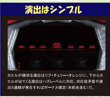
カエルが横切る演出はリブ・チェリー・オレンジに、下からカエルが出てくる演出はハズレ・レベルに対応。対応役矛盾や演出連続が発生すればボーナス確定(本前も含む)。

り分けられるし、リセットモードは初当たり確率が約170分の1ぐらいまでアップするから、そもそもそんなにハマらない。つまり、打つしかないよね？」 濱「う、うん。ま、全リセのホールならカニ歩きたいかな」 み「で、運良くリセットで当てて天国に行ったらとしましょう。となると、確実に大量出玉に繋がっちゃうよね。天国モードは設定不問で75%継続なんだから、一撃数千枚の獲得は余裕だよな？」 濱「ま、沖トロの奇数設定と同等の連チャン率と考えれば、そうな可能性はあるね」 み「でも、それで終わりにやらないだよ。天国終了後は25%で引き戻しに、37%で通常Bに移行。つまり、かなりの割合でどちらかのモードに振り分けられるんだから、引き戻しモードなら最大天井が512Gになる上に約40%で天国に、通常Bなら約40〜55%で天国に移行しちゃうの。つまり天国後も即ヤメは厳禁だよな？」 濱「確かに。なら、そこで天国に上がらなかつたらヤメかな」 み「いや、それがそうもいかないんだよ。天国到達までモードダウンしない仕様だから、一度当たった時点で天国まで追いたくなるし、