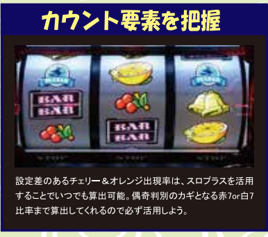
設定差のあるチェリー・オレンジ出現率は、スロプラスを活用することでいつでも算出可能。偶奇判別のカギとなる赤7or白7比率まで算出してくれるので必ず活用しよう。