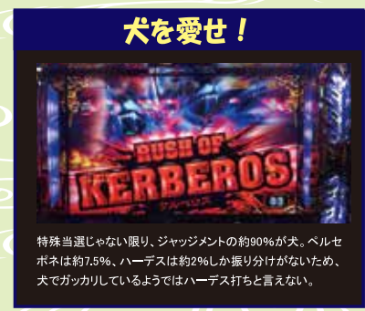
犬を愛せ! 特殊当選じゃない限り、ジャッジメントの約90%が犬。ベルセポネは約7.5%、ハーデスは約2%しか振り分けがないため、犬でガッカリしているようではハーデス打ちと言えない。

濱「名機である点については僕も異論ないね。かなり打ち込んだマシンだし、楽しさについてはこそこ理解してるつもりだよ。たださ、ほとんど犬じゃない。あれがどうにもしんどいんだよ」 み「それは分かる。でも、そういう