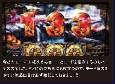
今どのモードにいるのかなあ……とモードを推測するのもハーデスの楽しさ。ヤメ時の見極めにも役立つので、モード毎の出やすい液晶出目は必ず暗記しておきましょう。

濱「さすがに65536分の1って感じだね」 み「その通り。まさに引きたいフラグって感じですね。あの格好良さとい、アレさえ引いたらその日は負けても納得ですよ」