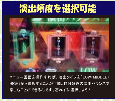
メニュー画面を操作すれば、演出タイプを「LOW・MIDDLE・HIGH」から選ぶことが可能。自分好みの演出バランスで楽しむことができます。忘れずに選択しよう!

直、ストレスでしかないから」 み「たしかに。ただ、今回は演出バランスを『LOW・MIDDLE・HIGH』から選ぶことが可能。自分好みの演出バランスで楽しむことができるんです。忘れずに選択しよう！」