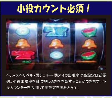
ベル・スベリベル・弱チェリー・弱スイカ出現率は高設定ほど優遇。小役出現率を軸に押し退きを判断することができます。小役カウンターを活用して高設定を掴みとろう!

み「人気シリーズの最新作にあたる本機なんですけど、今作は完全に原点回帰。高ベース&ボーナス主体タイプという本場に遊びやすい仕様になってるんだよね」 濱「仕様にそれはわかる。小役カウントも有効なんでしょ？」 み「イエス。というか、小役カウントと言えは本シリーズの代名詞と言っても良い要素だからね。展開によっては推測要素が集まらない台が多いけど、本機においてはその心配ナシ。完璧とまでは言えないけど、2〜3千ゲームも消化すれば設定の高低ぐらい分かるよ。設定が分からないまま粘らされる……ってケースは皆無だね」 濱「まさに5号機初頭に流行ったタイプって感じか」 み「しかも、今作はビッグの獲得枚数が種類を問わず400枚以上なんだよ。獲得枚数の少ないノーマルビッグに泣かされて……みたいな展開もないんです！」 濱「ほほう。で、REGは？」 み「それは104枚。正直なところ、REGは残念ボーナスと言わざるを得ないね。ただ、BR比率も6対4ぐらいだし、なによりビッグが連チャンした時の出玉増加速度は現役屈指だから。設定推測の軸が小役出現率のおかげで、ビッグのヒキによってはプラス域のまま低設定を見切れるなんてことも少なくないよ」 濱「なるほど」 み「あと天井も良心的だね。ビッグ後は999Gハマリ、REG後は799Gハマリで天井到達で次回ボーナスまで継続するRTに突入。期待値は高くないけど、低リスクな天井狙いも可能」 濱「確かに大負けはしなそうなお仕事だね。ただ、個人的に苦手なタイプだね。あのシリーズってアツクもないのに演出がゴリゴリ発生したり、当たってもないのに連続演出に発展しまくるでしょ。正