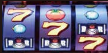
通常A中にボーナスを引けるか否か、この叩き所が明確なところが最高なわけで、ボーナスを引けた時の喜びは筆舌に尽くし難い、この喜びこそがパチスロの醍醐味だ。